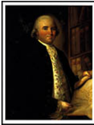
Juan Bautista Muñoz