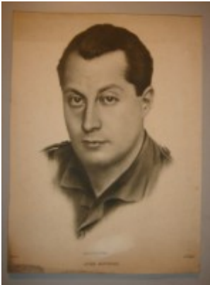
José Antonio Primo de Rivera

Nació en Madrid en 1903. Fue abogado. Candidato a las elecciones de 1931 en las que no obtuvo representación. Fundó, junto a Ruiz de Alda, el partido Falange Española, en 1933.