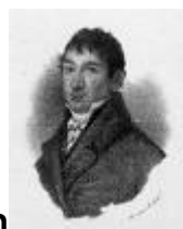
Leandro Fernández de Moratín