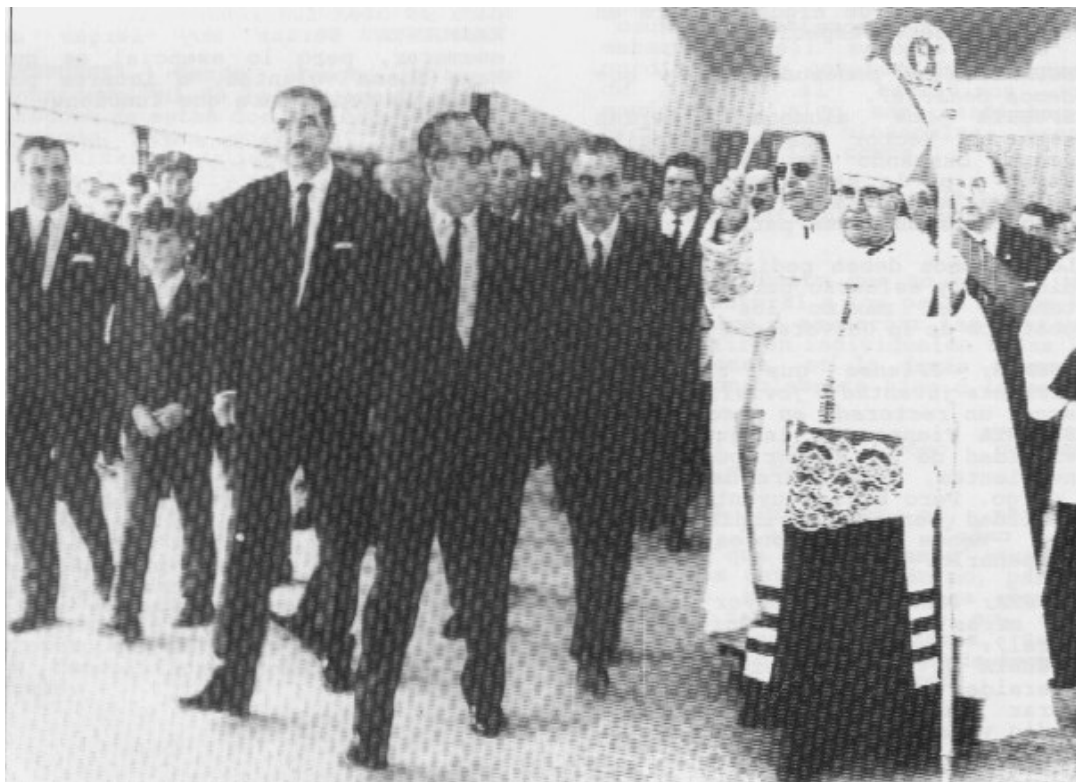
Ministro de Trabajo, Rector y Obispo