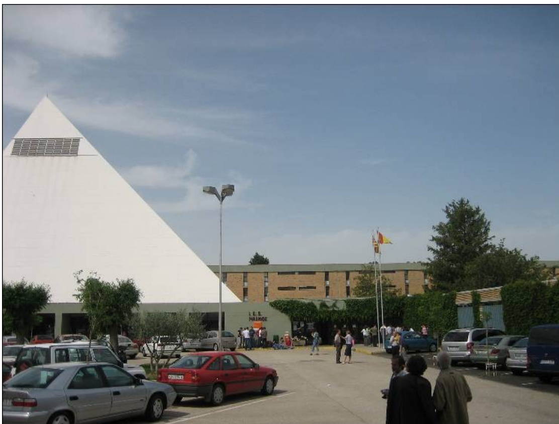
Entrada principal Universidad Laboral de Huesca