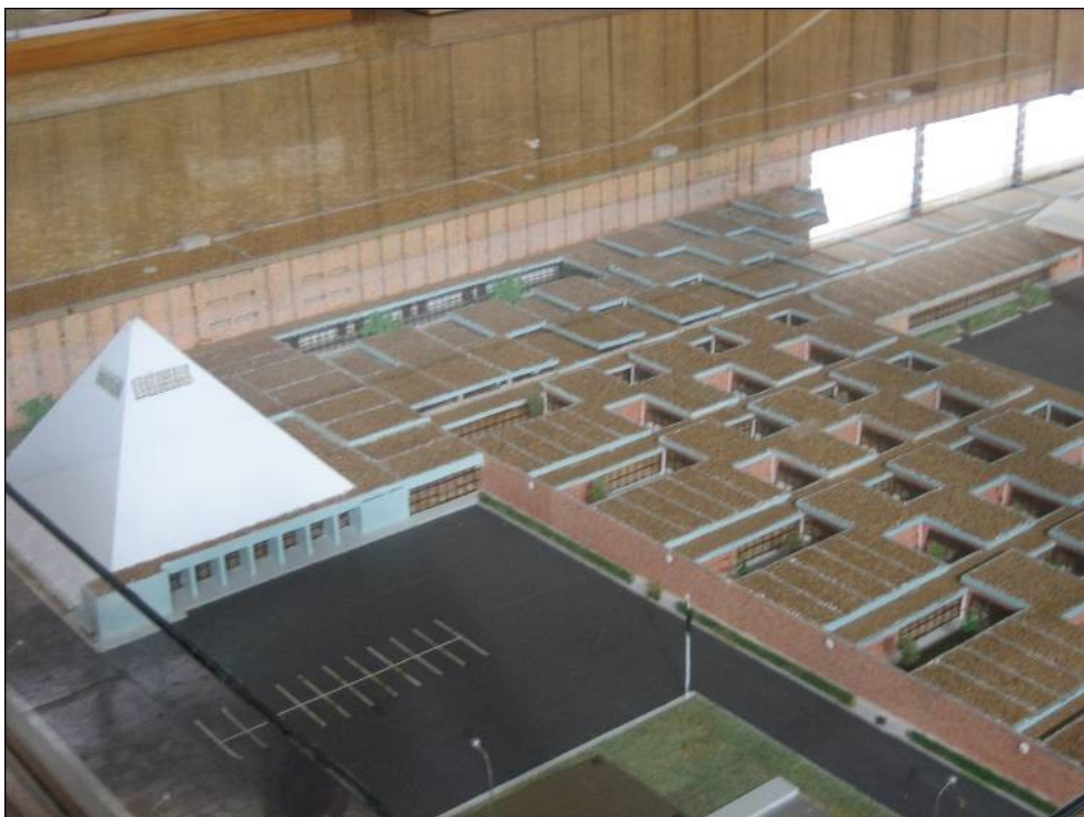
Maqueta Universidad Laboral de Huesca

Se reconoce el derecho de las mujeres trabajadoras a una adecuada educación laboral que podrá organizarse ya en una Universidad propia o en Secciones distintas que dependan de las Universidades Laborales existentes siempre a base de la separación de sexos, tanto en los edificios como en las enseñanzas.